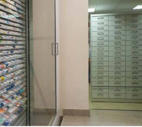
3 columnas de cajones Fama GX para almacenar los medicamentos de baja rotación