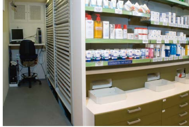
El almacenamiento de los medicamentos se realiza de forma centralizada desde atrás