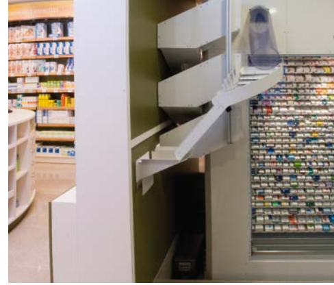
La dispensación de los medicamentos se lleva a cabo exclusivamente mediante sencillas rampas hacia un total de 4 puntos de entrega