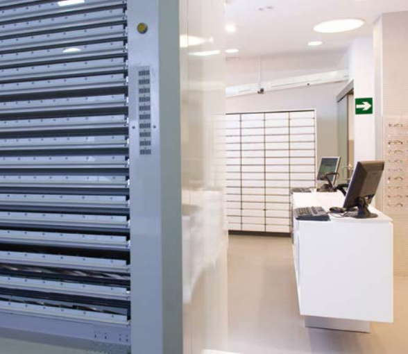
Parte posterior CONSIS