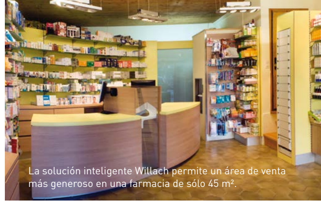
La solución inteligente Willach permite un área de venta más generoso en una farmacia de sólo 45 m 2 .