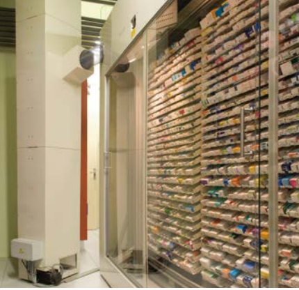
Colocación del dispensador automático CONSIS en el sótano.