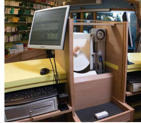
Consis Liftmaster sube los medicamentos hasta la caja 2 directamente desde el dispensador automático. 1